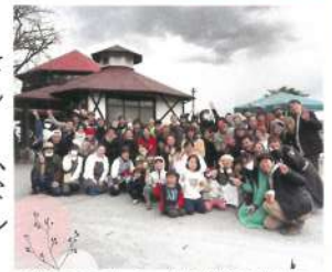
昨年のマルシェ出店者の皆さん

明覚駅前の桜が咲く頃。駅前の駐車場とその周辺を会場に、マルシェを開催します。おいしいもの、素敵なもの、嬉しいこと、楽しいことなどがギュッとつまったマルシェです。